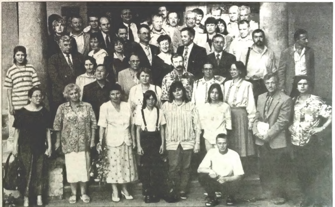
На ганку былой Віленскай Беларускай Гімназіі.